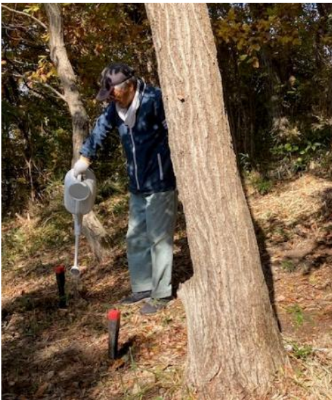
植樹後しっかり水やりをしておく