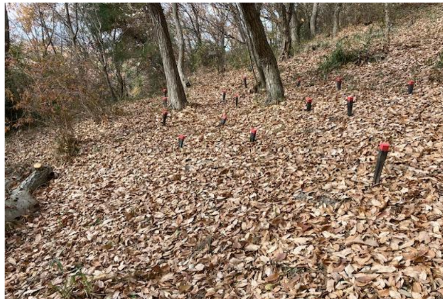
昨年の第 1 陣の移植場所から少し外れた場所に移植完了。芽吹いてくるのは 15 か月後の 2026 年 3 月の予定。