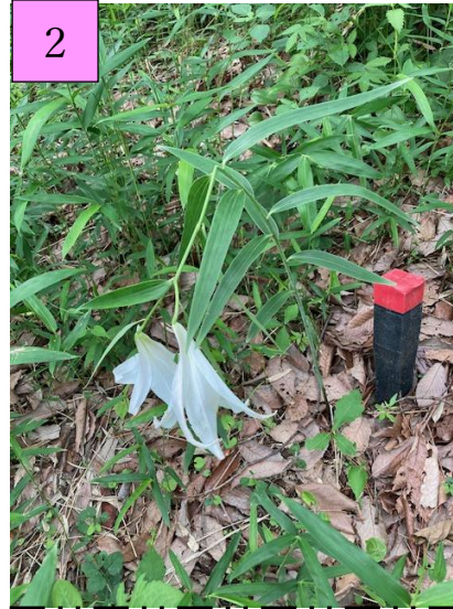
開花 これも腰折れ状態