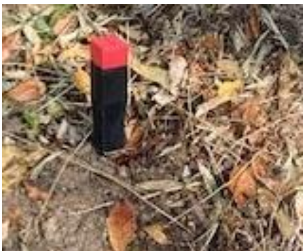
杭を打ち込み植え付け場所の表示をしておく