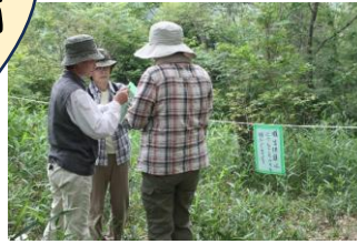
希少植物保護エリア の立ち入り制限表示