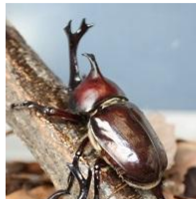
ササユリ カブトムシ