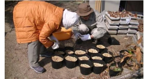
ササユリ他希少野草 の種植え作業