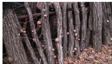
シイタケやシバグリ 収穫の楽しみも