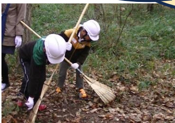
産卵場所づくりに頑張る子どもたち

カストムシの産卵場所づくりから幼虫～成虫 までの生育観察(親子自然環境体験の場)