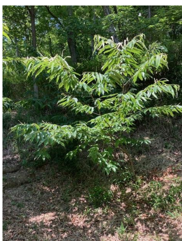
2023年8月時点の生育状況 植えた4本中3本が順調？に育つ