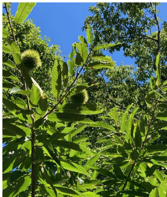
2025年10月時点の生育状況