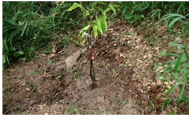
クリ苗4株の植樹終了