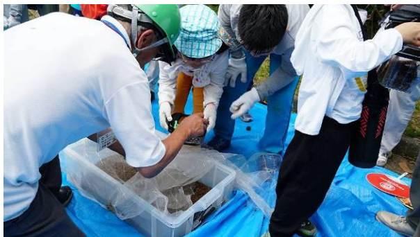
【カブトムシのプレゼント 持ち帰り観察・飼育】