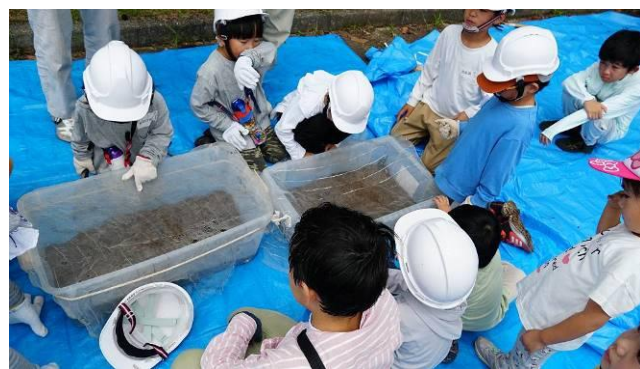
【見つかったカブトムシはいったんケースに仮入れ】・・・触りたくてしかたない