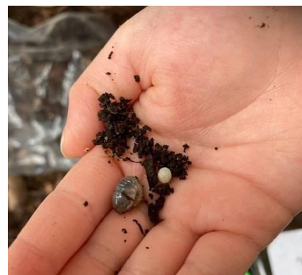
卵と1 齢幼虫も見つけ！