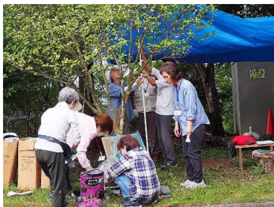
スタッフ朝礼後ただちに受け入れ準備にかかる