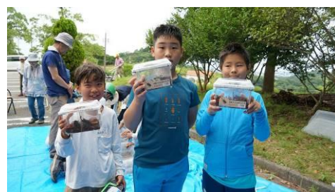
じゃんけんで勝ち抜いた3 家族には雌雄ペアのプレゼント⇒7 月中に卵を産み、10 月ころにはたくさんの3 齢幼虫に育つから、自宅で飼育できない分はここに里帰りさせるんだよ。