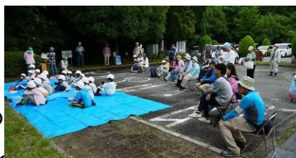
参加者みんなでお勉強

六甲山は、昔は木を燃料にするため切りすぎてはげ山になり、災害が多かったこと。その後、山で働く人たちが木を植え立派な森によみがえったこと。しかし燃料として使わなくなった森は、繁りすぎて暗くなり、草花が育たない。花が咲かないと昆虫も来なくなり、昆虫をエサにする野鳥も来なくなってしまった。最近では、いろいろな人たちが森の手入れをするようになり、ここでも珍しい草花もたくさん咲きはじめ、カブトムシもたくさん育つようになったんだよ。