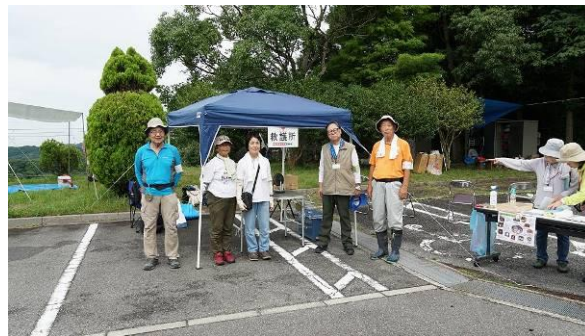
救急救護班の設置も完了