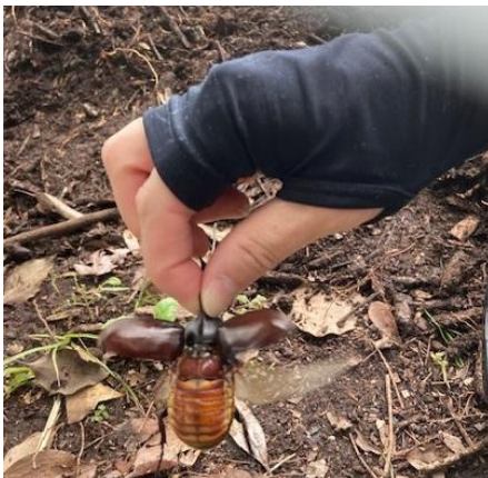
「放してくれ～」羽をはばたき飛びたとうとする元気な成虫君