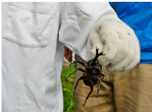
そうそう つかむときは角がいいんだ。