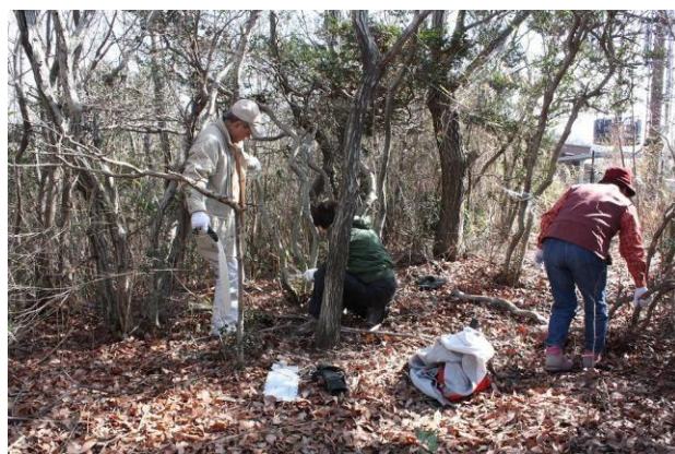
手のこによる小径木の伐採作業では女性メンバーも実力発揮