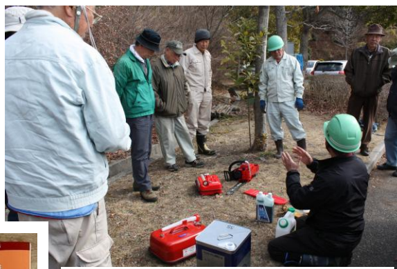
講座の後は実地の講習に入る。