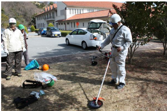
チェーンソーにつづき刈払機の安全講習を受講。