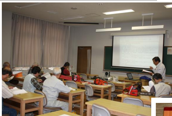
教材冊子に基づき室内での講座