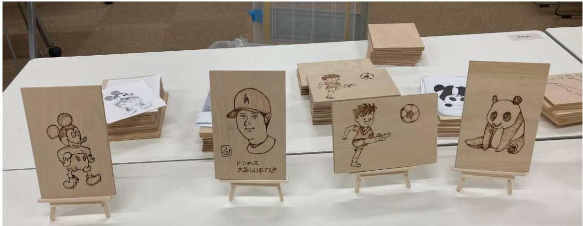
ミッキーマウス 大谷翔平 サッカー少年 パンダ