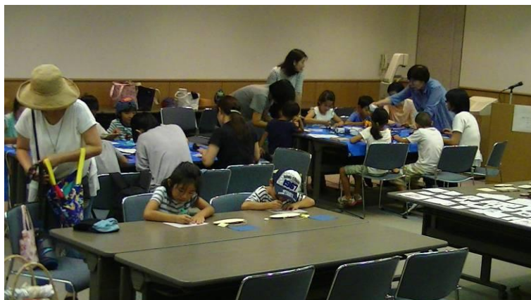
実施要領説明後「ヒートペンに気を付けて・・・」と注意を連絡し作業開始。