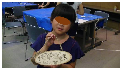
そろそろ出来上がってき ました。