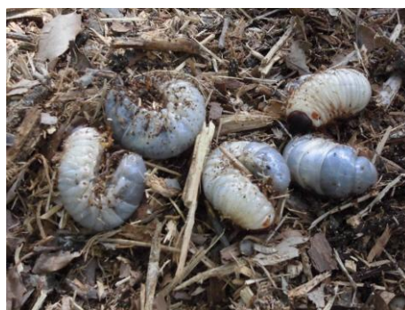
9月～10月 腐葉土を餌に丸々と育った3 齢幼虫 この後3 月頃まで冬眠にはいり、4、5月はしっかり食べてさらに大きく育つ