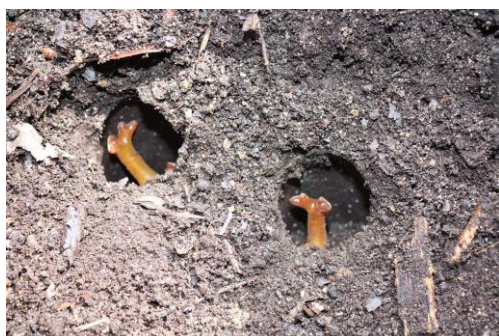
翌年6月下旬 前蛹(さなぎ)の観察(2)