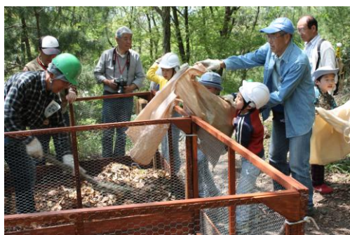
チップや枯葉で棲み家(オチバンク)づくり 7～8月頃にはここで産卵・孵化がはじまる